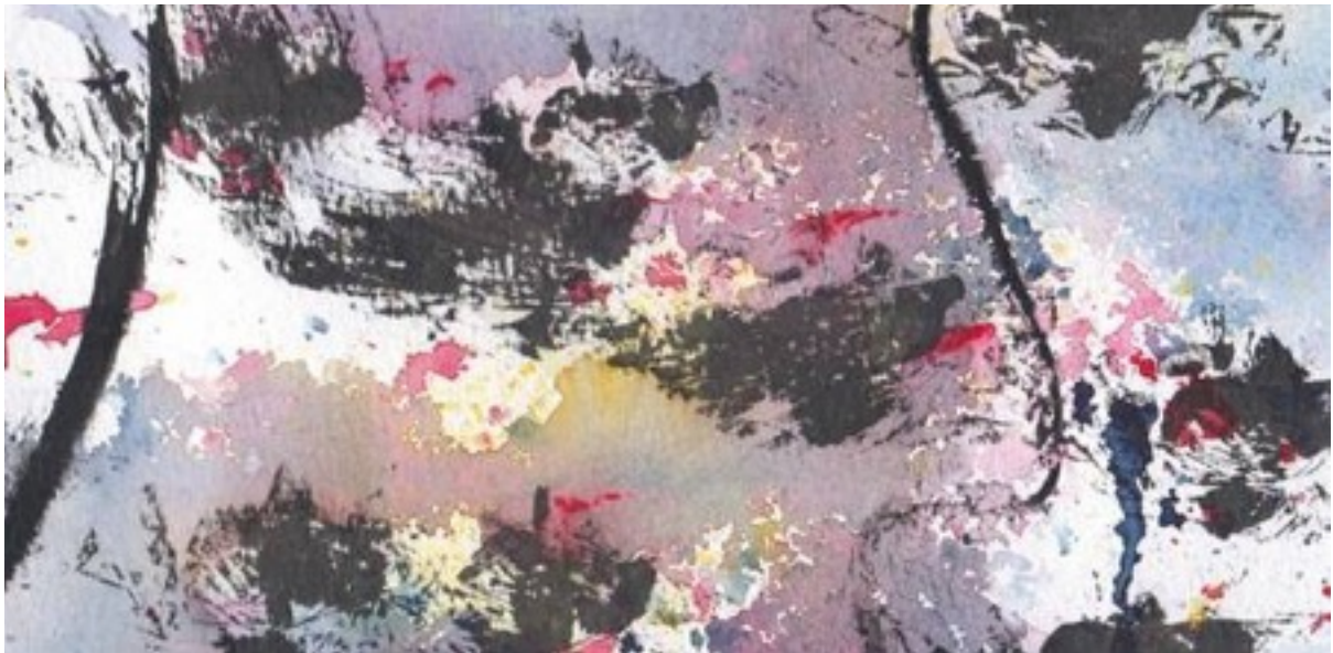
Peinture illustrant : L'énergie saturée

La lenteur sera une réflexion sur l'instant présent et sur l'énergie qui nous entoure.