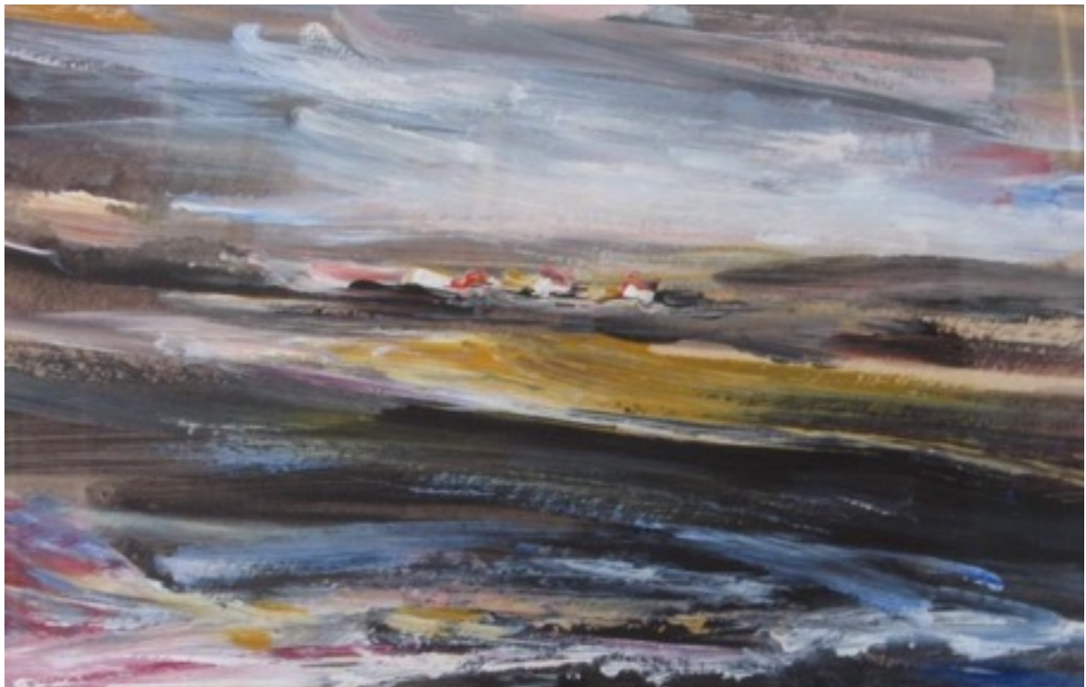
Peinture illustrant : La vitesse de la dégradation